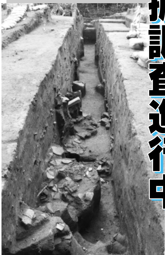
発掘調査現場の様子

が出土し、赤土（ローム）を多量に捨てたことよってできた盛土の存在が確認されました。今年度の発掘調査地点は、盛土が見つかった雑木林の丘の周辺になります。