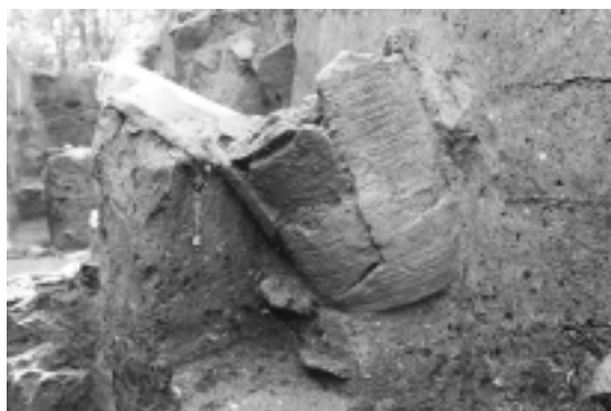
埋設土器（子どものお墓）

とや、建物が建てられたあとながなが確認を行います。 土の回収・調査 捨てられた土の中には炭になった木が多量に含まれていることがわかっています。また、食料となった木の実や動物の骨、石器を作った際にできる小さな石屑などが見つかることも多く、小さな遺物の内容にも注意をして、当時の人々の暮らしについての情報を集めます。