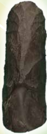
局部磨製石斧 東北町 長者久保遺跡