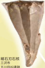
細石刃石核 三沢市 五川目(6)遺跡