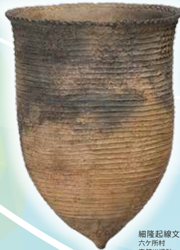
細隆起線文土器(レプリカ) 六ヶ所村 表館(1)遺跡