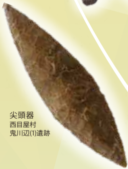
尖頭器 西目屋村 鬼川辺(1)遺跡