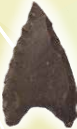
石鏃 野辺地町 明前(4)遺跡