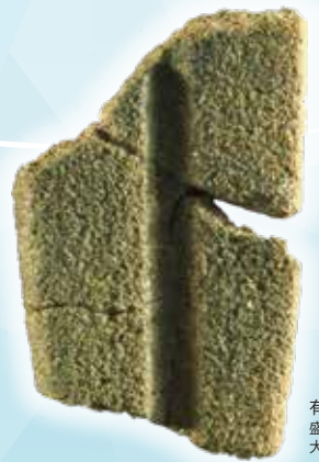
有溝砥石 盛岡市 大新町遺跡