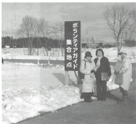
ボランティアガイド集合地点

ボランティアガイドの出發場所も「時遊トンネル」を出たところが変わりました。案内時間は最初が九時十五分から、その次が十時から一時間おき、最後が三時半からになります（季節によって変わる場合があります）。集合場所には大きな看板が立っています。