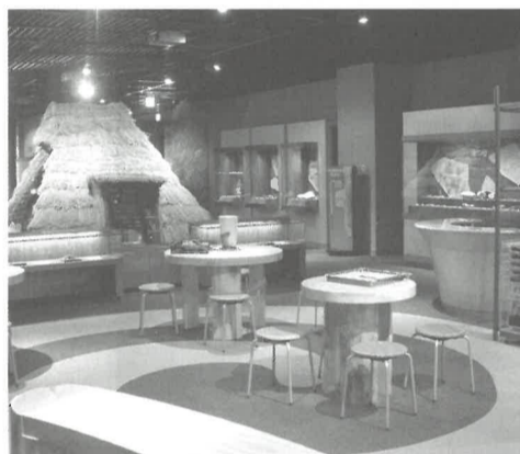
縄文ギャラリーのようす

て」楽しく縄文時代に触れるコーナーです。パソコンのゲームがある「冒険ライブラリ」や大型スクリーンなどがあります。