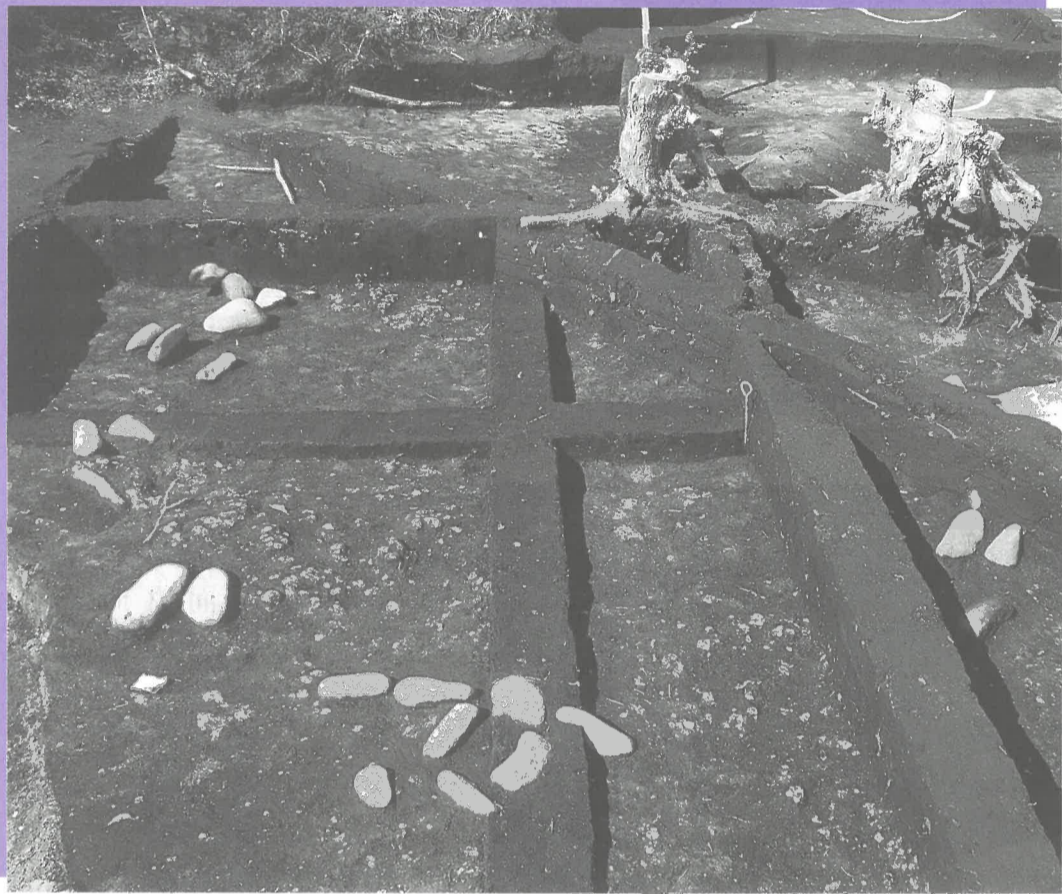
新たに見つかった環状配石墓 (第23次調査区)