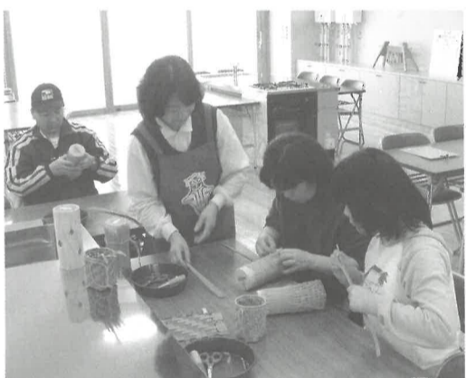
「体験工房」での体験学習

これまでは一部の時期を除いて、体験学習をするには団体で予約する必要がありますでしたが、個人の方も予約なしで、いつでも体験できるようになりました。「組みも作りと火おこし」、「まが玉作り」、「土偶作り」など、七つのコースがあります。所要時間は一〜二時間、