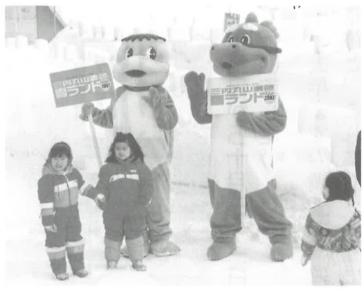
雪ランドでの1コマ