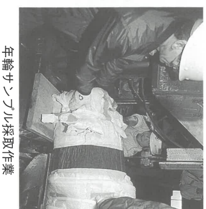
年輪サンプル採取作業