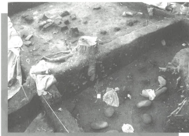
新たに見つかった環状配石墓（第24次調査）

発掘調査は今年も公開しています。第二十四次調査区で、発掘作業の様子を自由に見学することができま