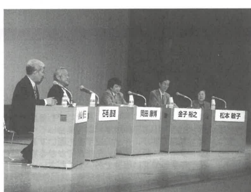
昨年の大阪シンポジウム

三内丸山遺跡の魅力を多くの方々に知っていただき、さらに楽しんでもらえるような企画を用意しておりますので、是非とも遺跡においでください。