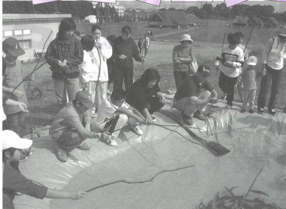
昨年度の体験学習（「海の考古学」）