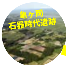
亀ヶ岡 石器時代遺跡